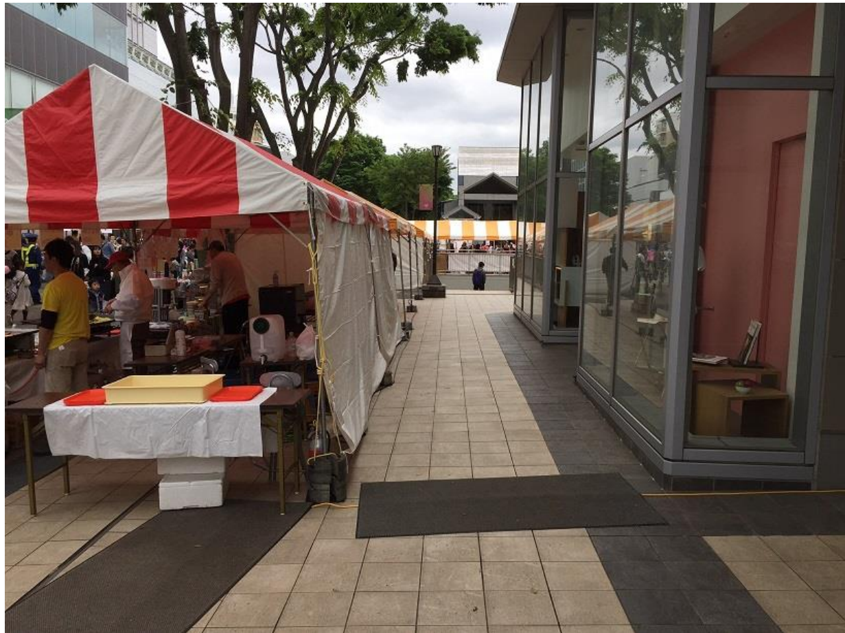
※テントの後ろ側も若干狭いですが走行可能です。