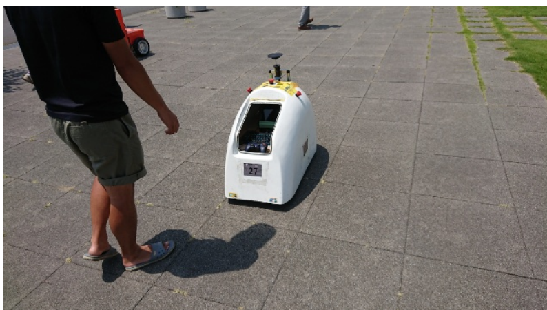
確認走行区間の自律走行時の様子