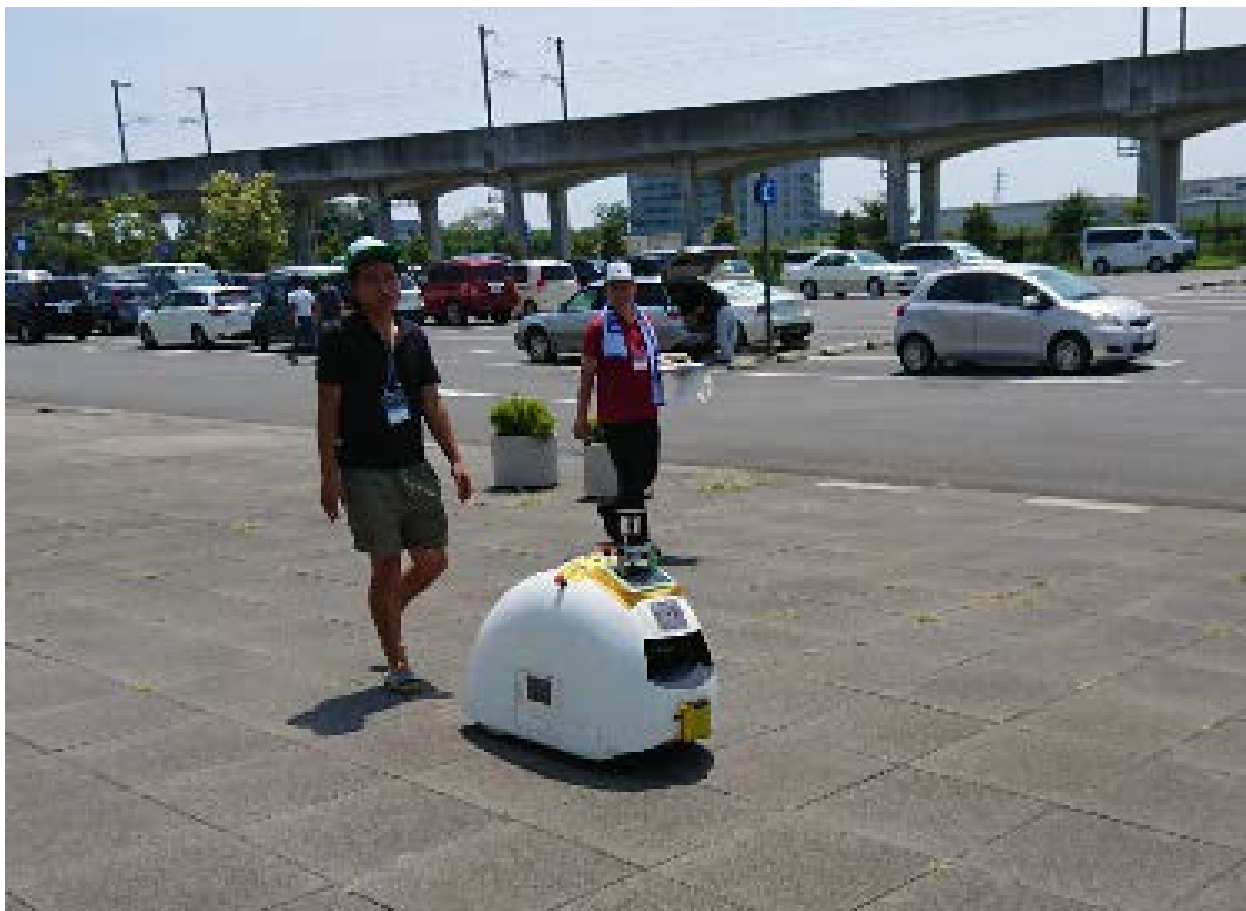
確認走行(本番)の様子